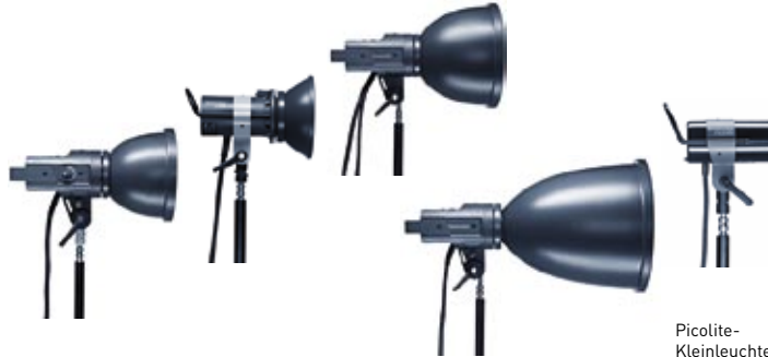
Pulso G 32.115.XX 1600 J Pulso G 32.116.XX 3200 J Unilite 32.113.XX 1600 J Unilite 32.114.XX 3200 J Pulso Twin 32.117.XX Pulso 8 32.118.XX Picolite- Kleinleuchte 32.021.XX Mobilite 2- Kleinleuchte 32.012.00