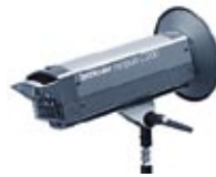
Minipuls C200 31.449.XX