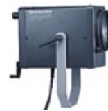
Pulso-Spot 4 32.425.XX