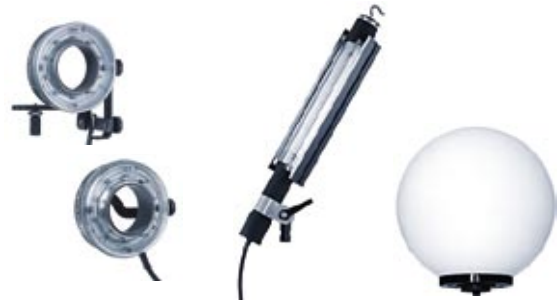
Ringflash C 32.462.XX Ringflash P 32.461.XX Litestick 32.451.00 Balloon 33.161.00