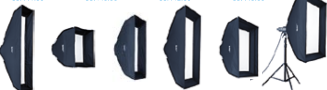
Pulsoflex EM 40 x 155 33.425.00 Pulsoflex EM 50 x 50 33.406.00 Pulsoflex EM 55 x 95 33.416.00 Pulsoflex EM 80 x 140 33.417.00 Pulsoflex EM 80 x 80 33.407.00 Pulsoflex EM 110 x 110 33.408.00