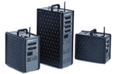
Topas A2 / RFS 31.168.XX / 31.173.XX Topas A4 / RFS 31.178.XX / 31.174.XX Topas A8 Evolution / RFS 31.184.XX / 31.183.XX