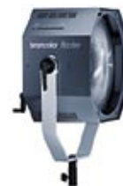
broncolor Floorer 32.431.00