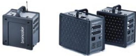
Mobil A2R 31.011.XX