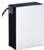
Boxlite 40 32.341.XX