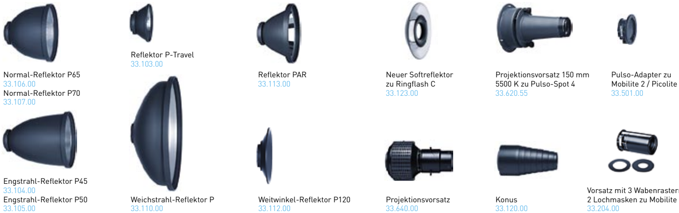
Normal-Reflektor P65 33.106.00 Normal-Reflektor P70 33.107.00