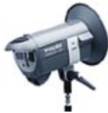
Minicom 80 / RFS 31.415.XX / 31.416.XX