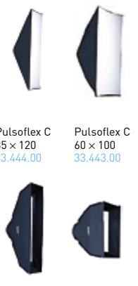
Pulsoflex C 35 x 120 33.444.00