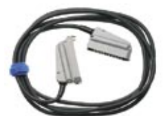
Verlängerungskabel zu Mobilite 2, 3,5 m