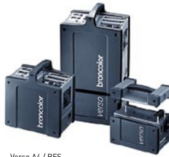
Verso A4 / RFS 31.032.XX / 31.033.XX Verso A2 / RFS 31.030.XX / 31.031.XX Power Dock zu Verso A2 / A4 / RFS 36.124.00