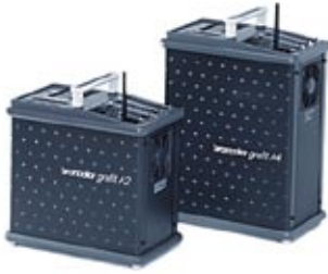
Grafit A2 / RFS 31.166.XX / 31.169.XX Grafit A4 / RFS 31.176.XX / 31.179.XX