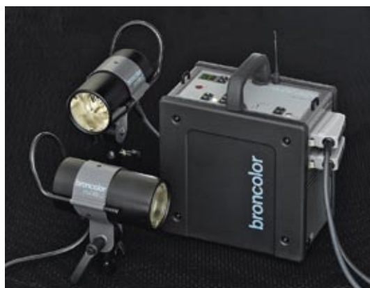
Mobil A2R mit Mobilite 2

Der Mobil A2R wiegt 9,2 kg und ist kleiner als ein Kamerakoffer. Durch seine durchdachte Konstruktion ohne vorstehende