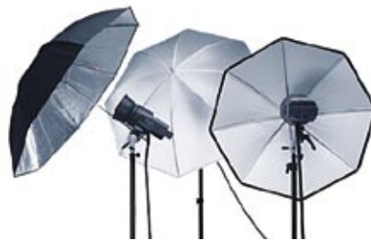
Schirm Silber 82 cm 33.459.00 Schirm Silber 102 cm 33.452.00 Schirm transparent 102 cm 33.454.00 Schirm weiss 82 cm 33.460.00 Schirm weiss 102 cm 33.453.00