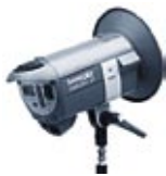
Minicom 40 / RFS 31.405.XX / 31.406.XX