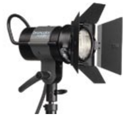
Mobilite 2 mit Abschirmklappe