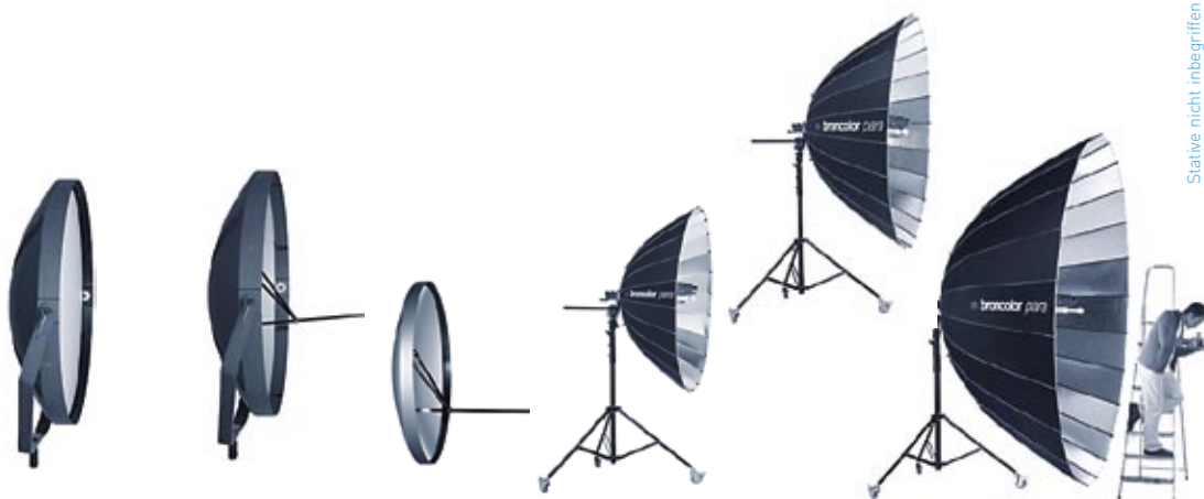
Satellite Staro 33.151.00